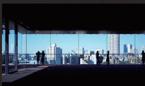
サントリー美術館