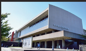
東京国立近代美術館