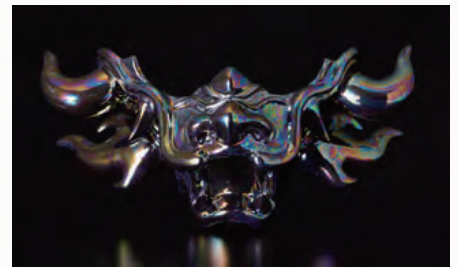
歴史的、文化的な背景を踏まえ古典への敬意のもとに創造される作品。オリジナル作品のリクエストも可能です。