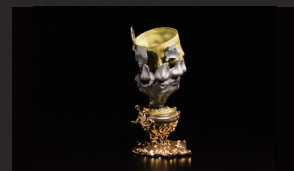
今村能章 / 沖縄