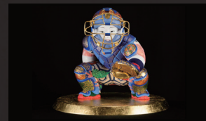
中村弘峰 / 福岡