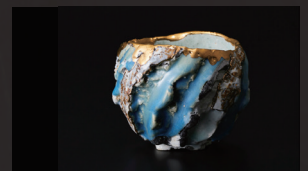
市川透 / 岡山 など