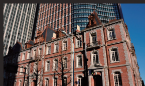
三菱一号館美術館 など