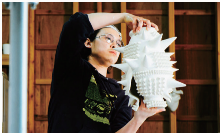
福岡と鹿児島にアトリエを構え、あえて地方からの発信にこだわる古賀氏の作品は、社会に対するカウンターとして強烈な存在感があります。