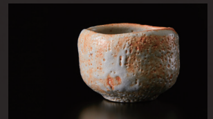
加藤亮太郎 / 岐阜