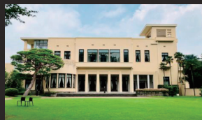
東京都庭園美術館